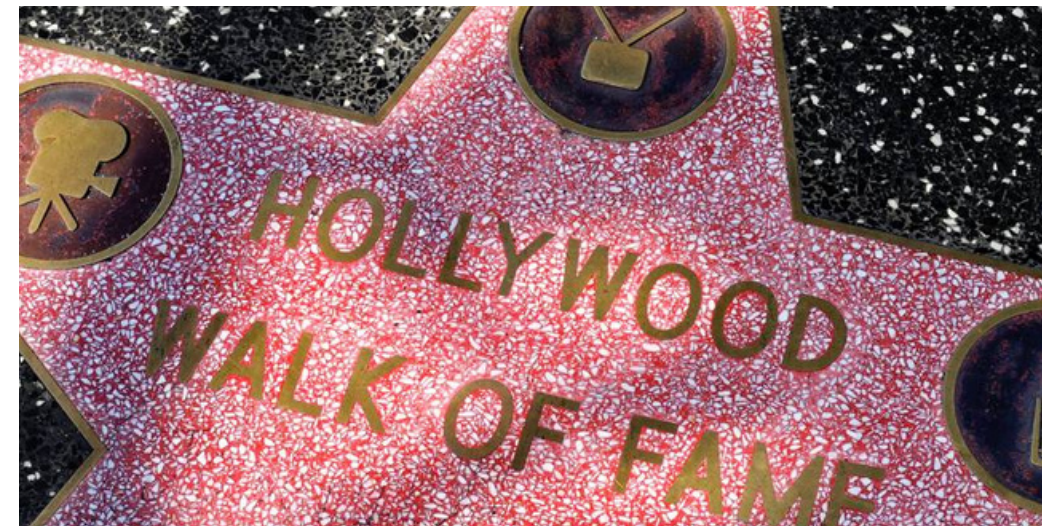
Walk of fame