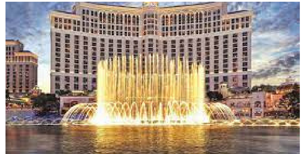
Fontane del Bellagio